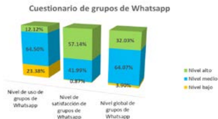
Figura 2. Nivel en la utilización del grupo de WhatsApp educativo

uso de grupos de WhatsApp (64.07%), en la dimensión nivel de satisfacción está en un nivel alto en la satisfacción del uso de grupos de WhatsApp educativo (57.14%), en cuanto a la dimensión de uso de grupos de WhatsApp el nivel medio es el que prevalece (64.50%).