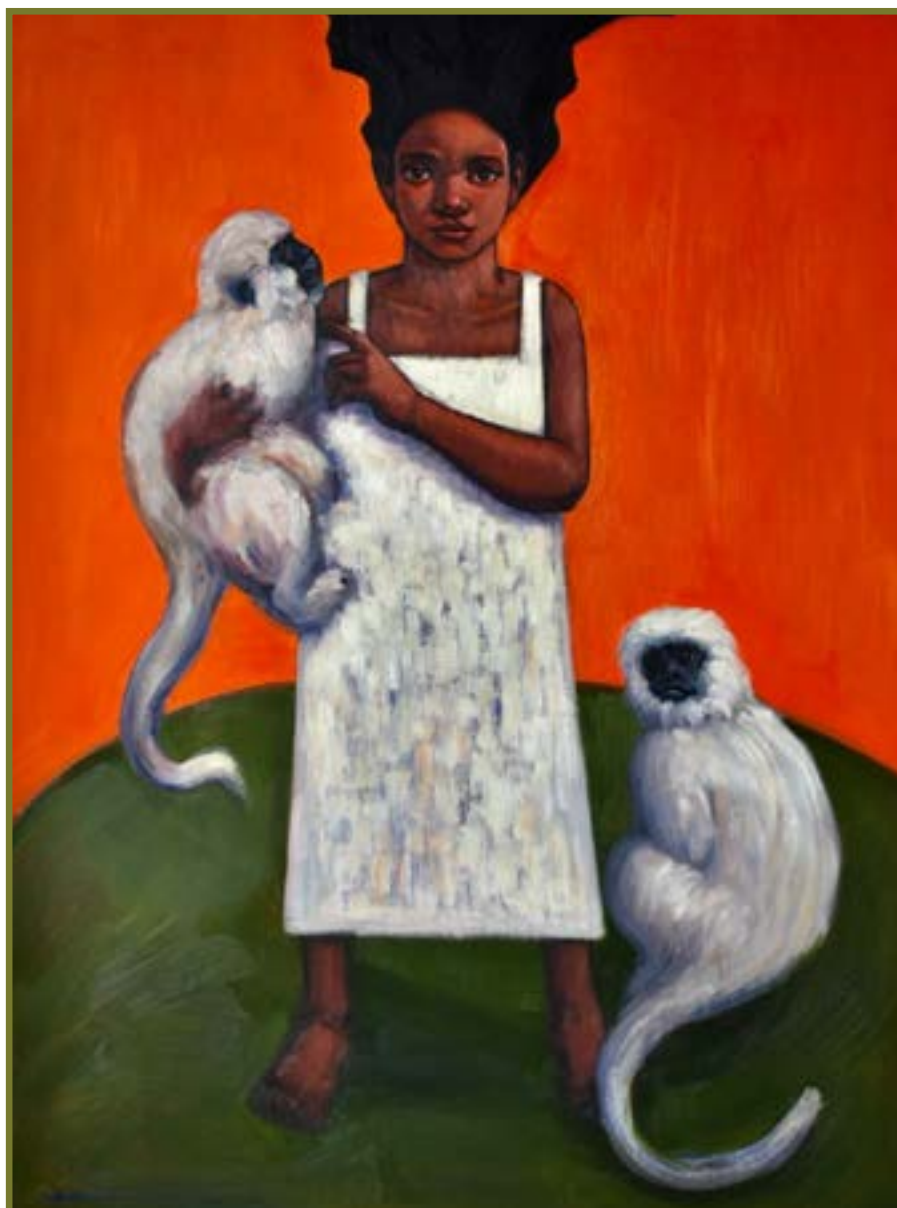
Niña y monos. Óleo sobre lienzo 120x150 cm. Diego Alcalde, artista plástico peruano (Lima, Perú 1986) https://www.instagram.com/diegoalcaldeart/?hl=es