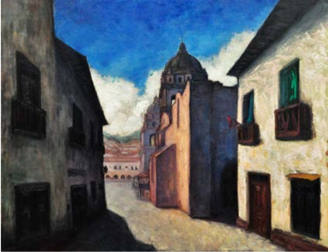
Calle cusqueña. Óleo sobre lienzo, 70 x 90 cm. Diego Alcalde, artista plástico peruano (Lima, Perú 1986) https://www.instagram.com/diegoalcaldeart/?hl=es