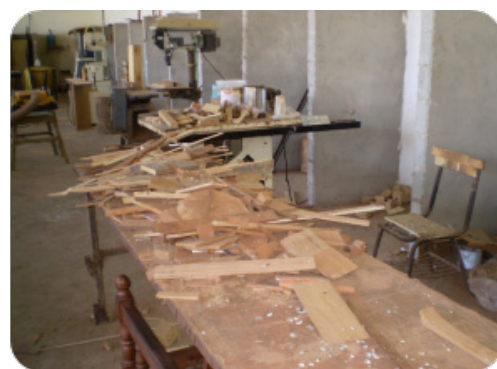
Imagen No2. Programa de Ebanistería Centro Penitenciario La Joyita Centro Penitenciario La Joya