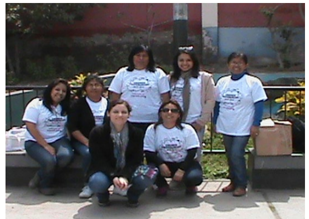
Figura 3. Docentes y estudiantes participantes del semillero de investigación DIECT-DUED-UAP-Lima.

Figura 2. Mensaje para la capacitación de las estudiantes del semillero de investigación.