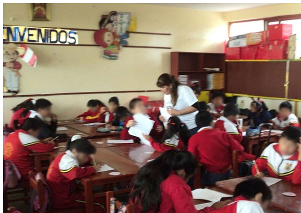
Figura 4. Evaluación realizada por una estudiante del semillero a estudiantes de primaria de una de las instituciones educativas participantes del proyecto bullying.

Etapa 4. Consolidado y resultado de aplicación de instrumentos de recolección de datos. Después de la aplicación de los instrumentos, las estudiantes de EAP Psicología Humana prepararon la base de datos (figura 5) para el análisis de los resultados, estos últimos sirvieron para realizar el consolidado y redactar el informe que se debía remitir a las instituciones educativas.