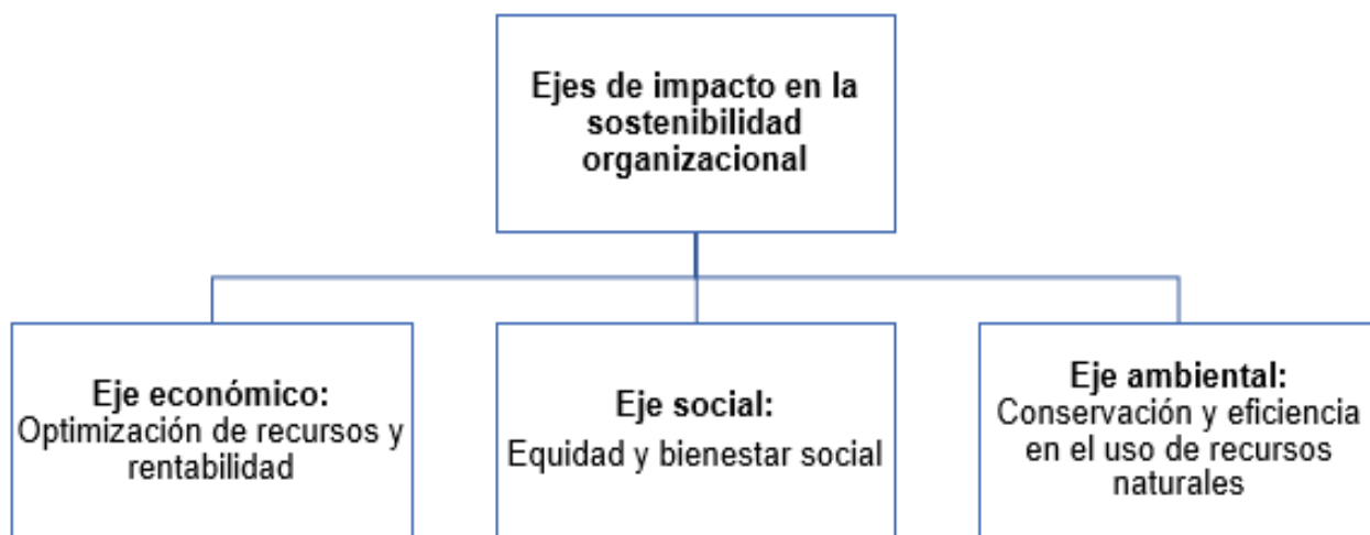
Ejes de impacto de la planificación estratégica en la sostenibilidad organizacional