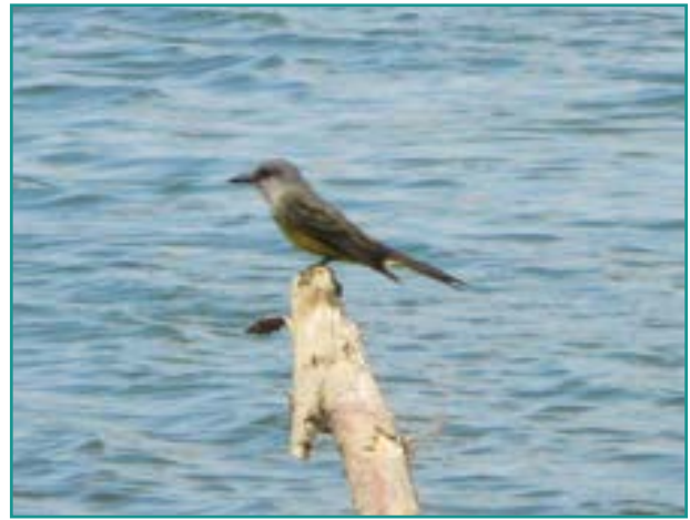
Fotografía 20. Avispero, tirano tropical ( Tyrannus melancholicus )