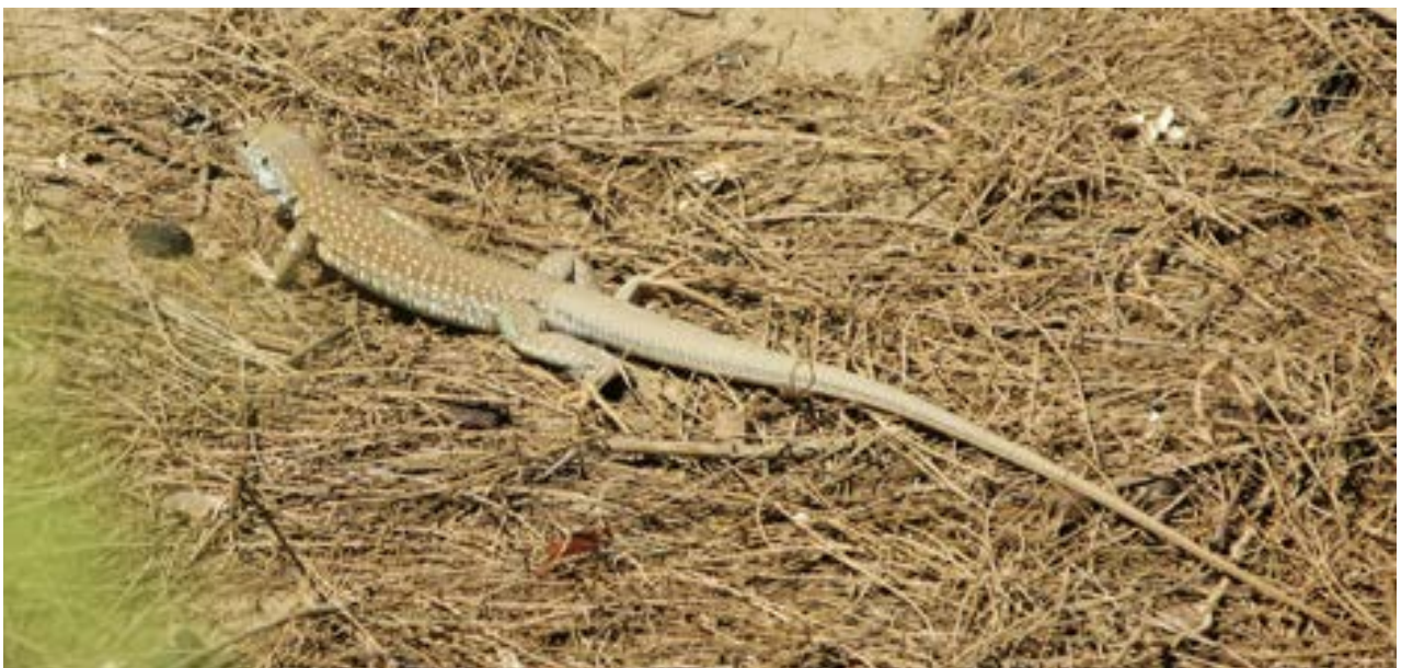
Fotografía 31. Cañán ( Dicrodon guttulatum )