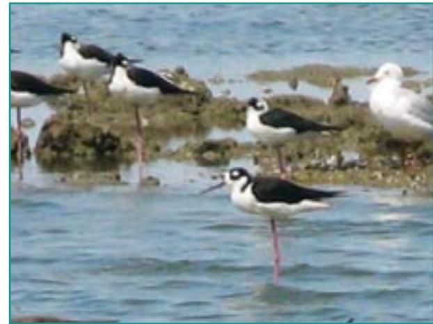
Fotografía 13. Cigüeñuela ( Himantopus mexicanus )