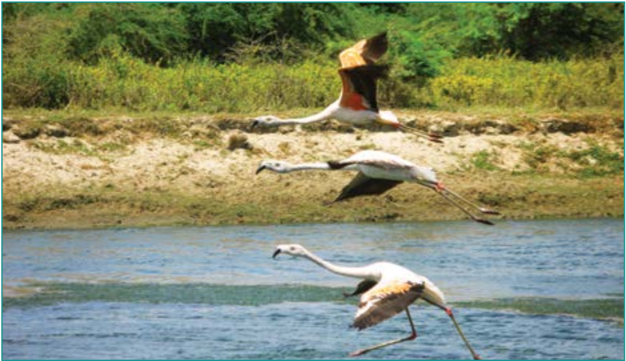
Fotografía 18. Flamencos ( Phoenicopterus chilensis )