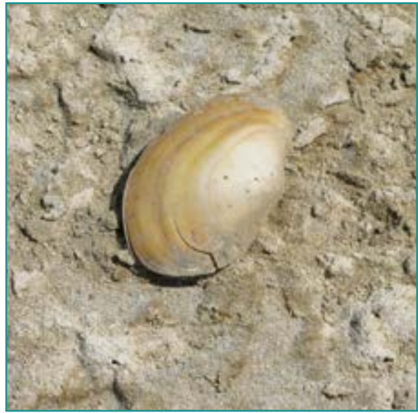
Fotografía 24. Almeja de agua dulce ( Anodonta anatina )