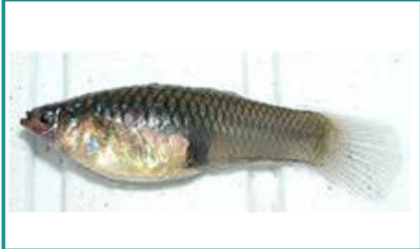
Fotografía 25. Guppy ( Poecilia reticulata )