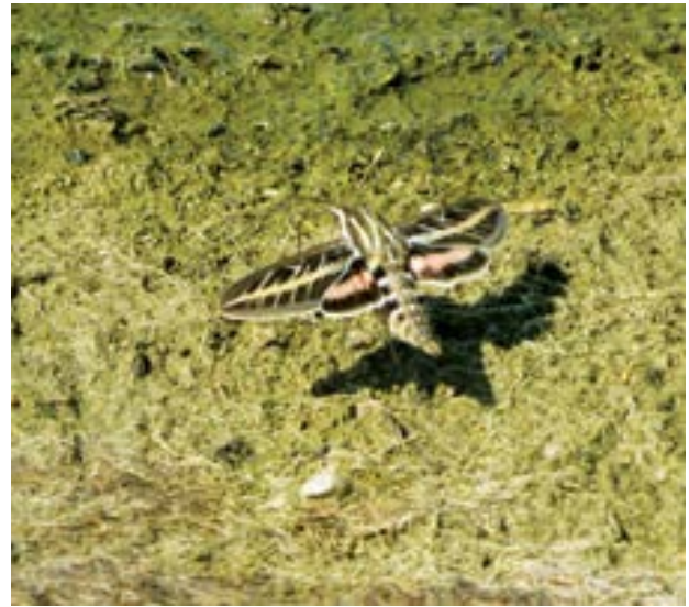
Fotografía 29. Mariposa