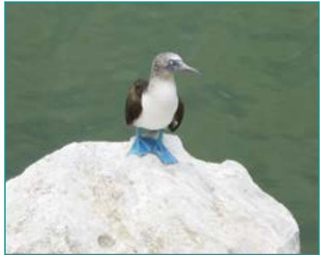
Fotografía 11. Piqueros ( Sula variegata )