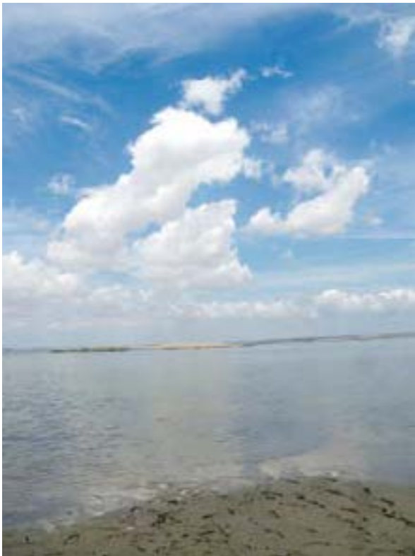
Fotografía 5. Segmento de la Laguna de los Flamencos. Médano Chico. Marzo de 2009