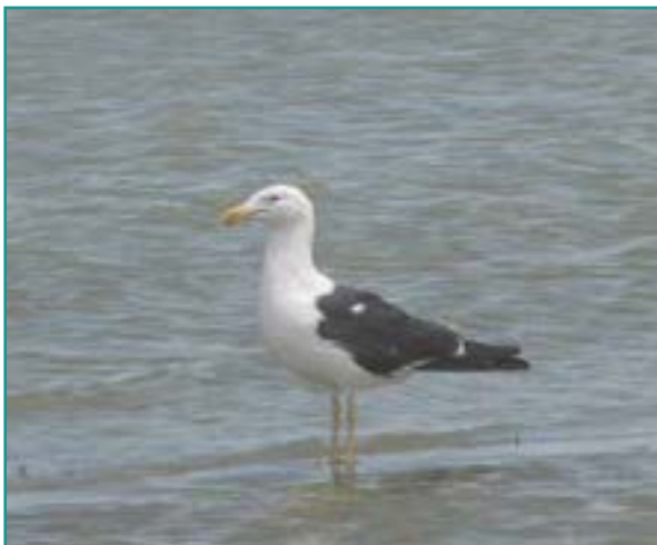
Fotografía 8. Gaviota dominicana ( Larus dominicanus )