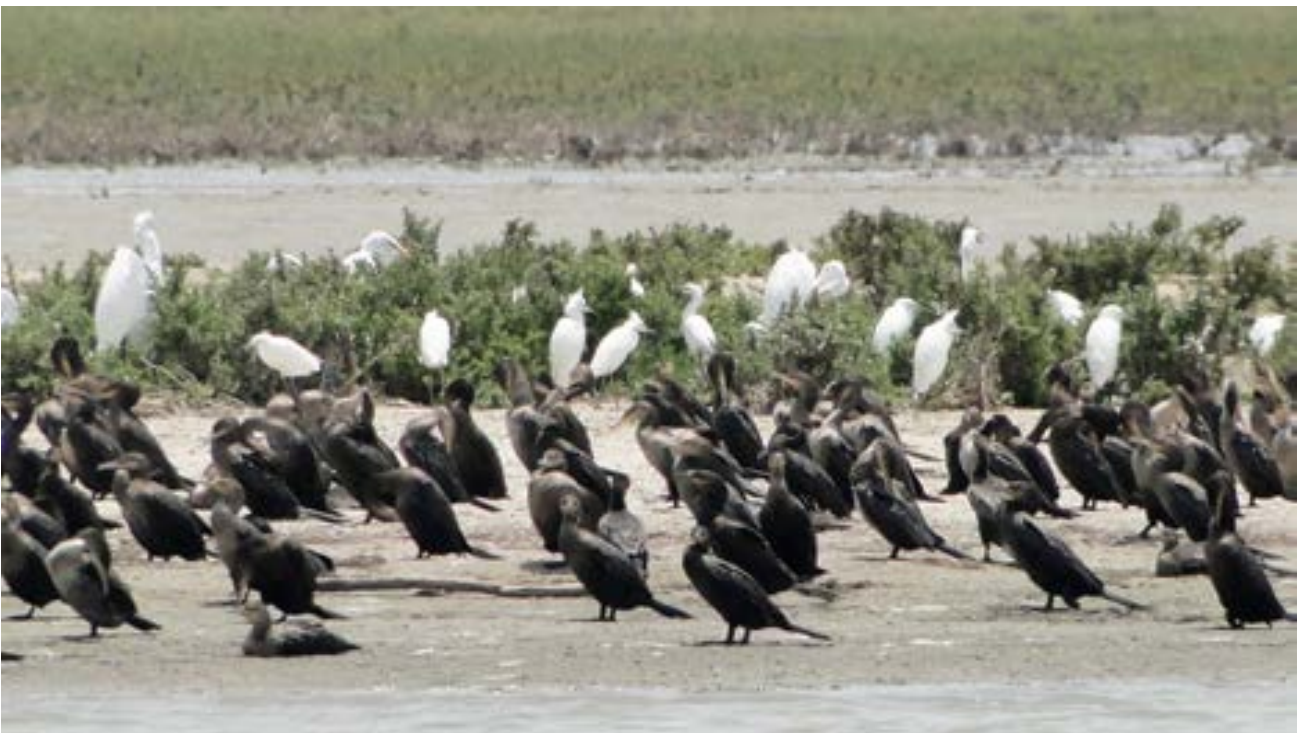
Foto 17. Nidos de aves, cormoranes y garzas