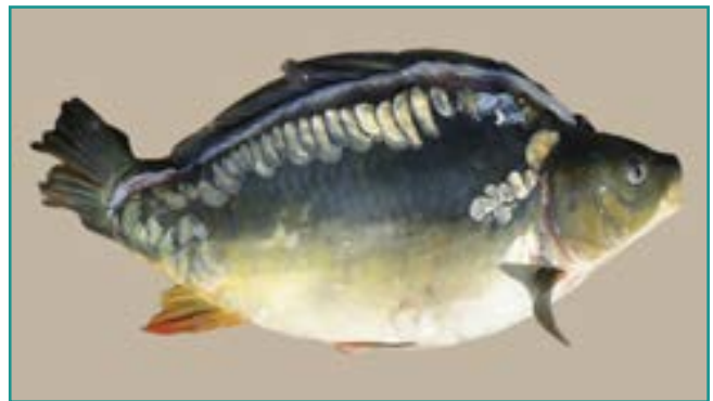
Fotografía 26. Carpa ( Cyprinus carpio )