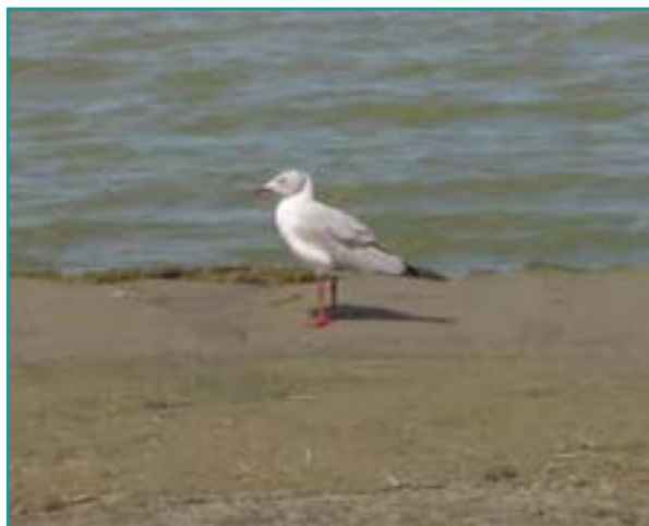
Fotografía 9. Gaviota gris ( Larus cirrocephalus )