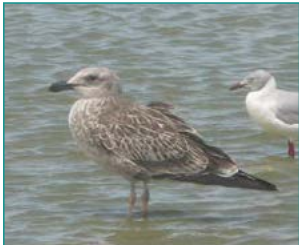
Fotografía 7. Gaviota juvenil ( Larus dominicanus ). Los especímenes juveniles se diferencian por el pico negro.