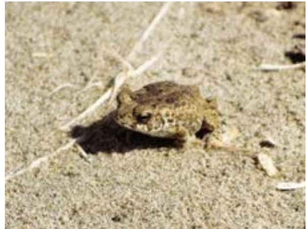
Fotografía 30. Sapo cololo ( Bufo sp.)