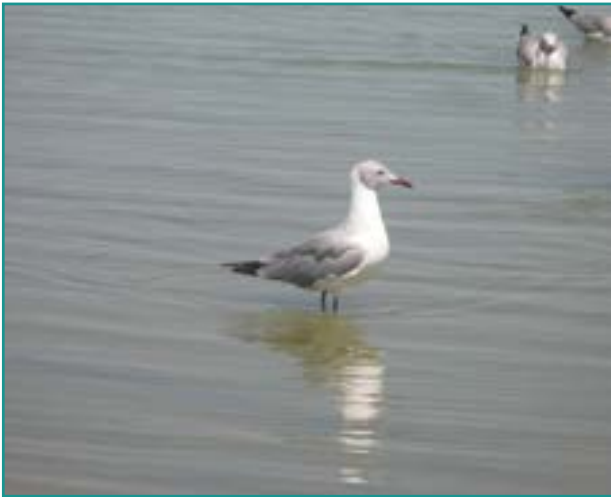
Fotografía 10. Gaviota peruana ( Larus velcheri )