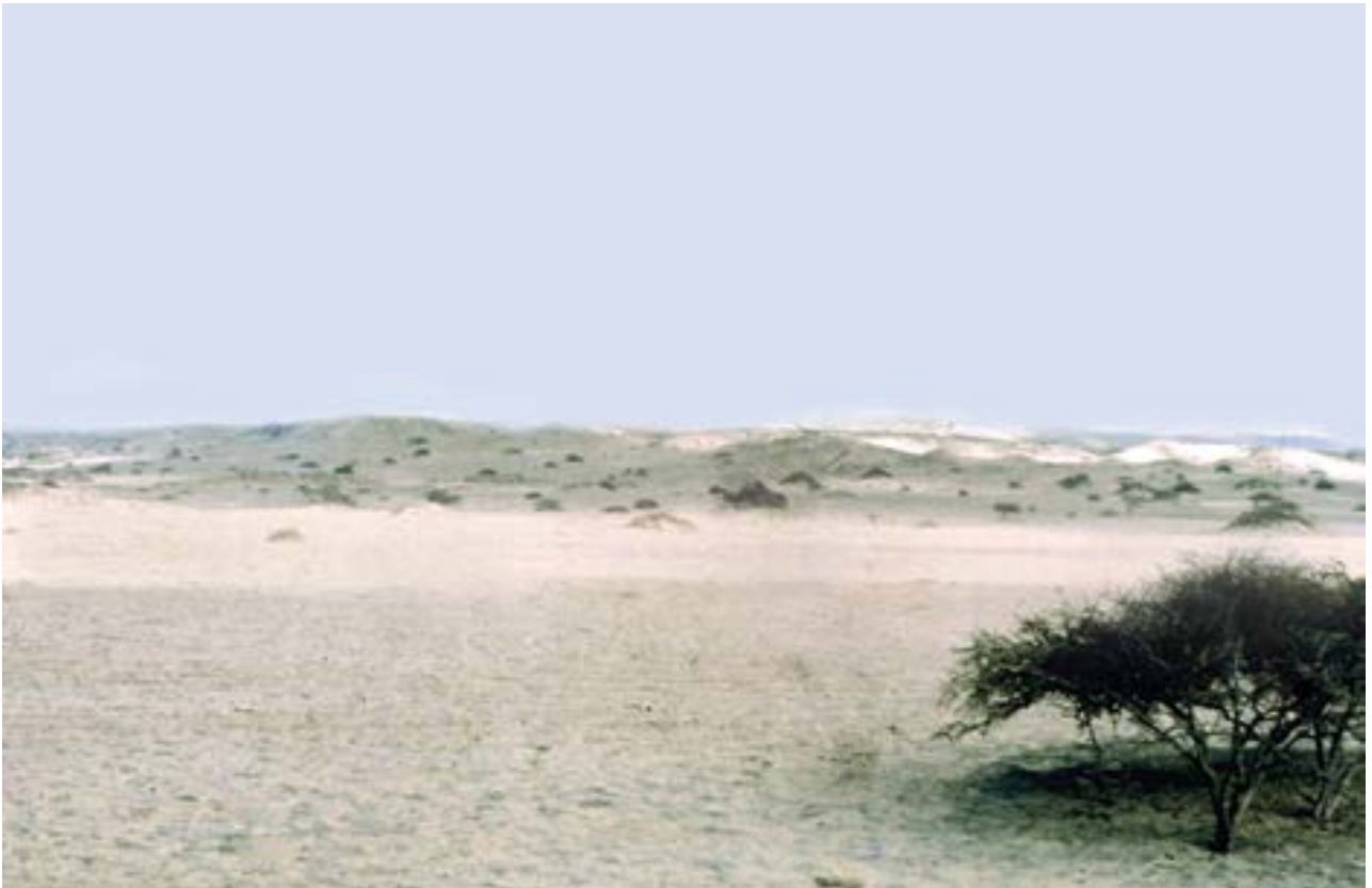
Fotografía 1. Pampa de San Antonio. Desierto de Sechura, 1978