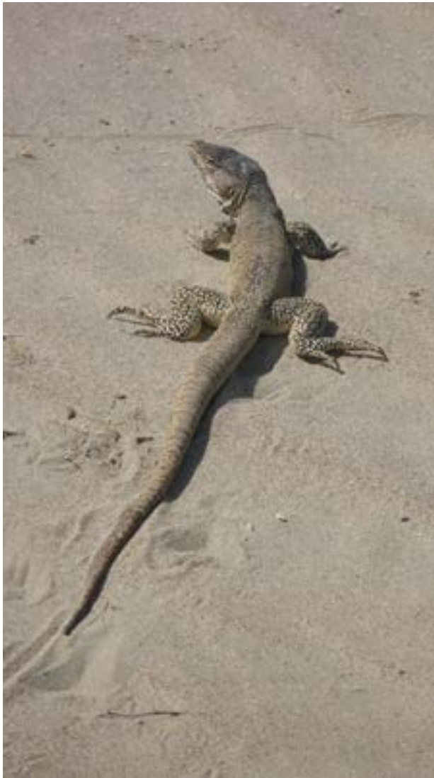
Fotografía 28. Iguana ( Callopistes flavipuntatus )