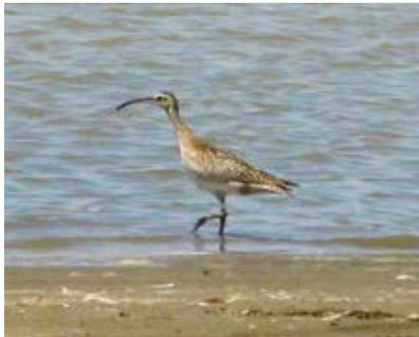
Fotografía 6. Sarapito trinador ( Numenius phaeopus )