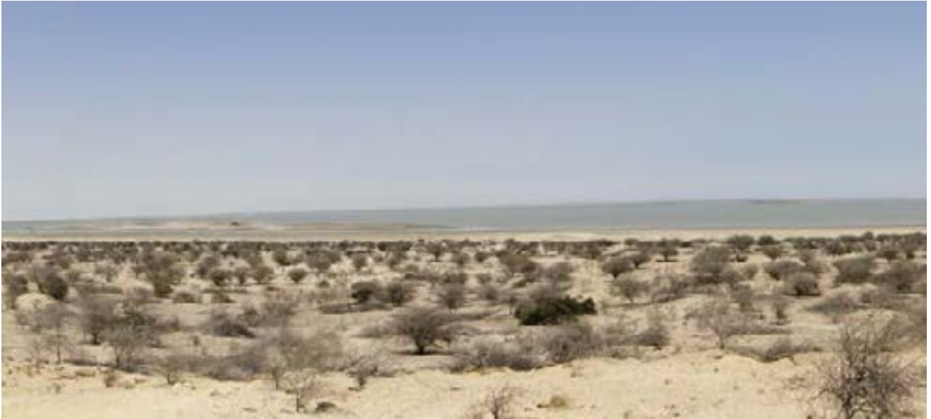
Fotografía 3. Segmento Este de la Laguna de los Flamencos. Sector entre Médano Grande y Chocol. 9 de septiembre de 2010