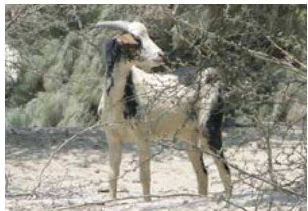
Fotografía 27. Cabra ( Capra hircus )