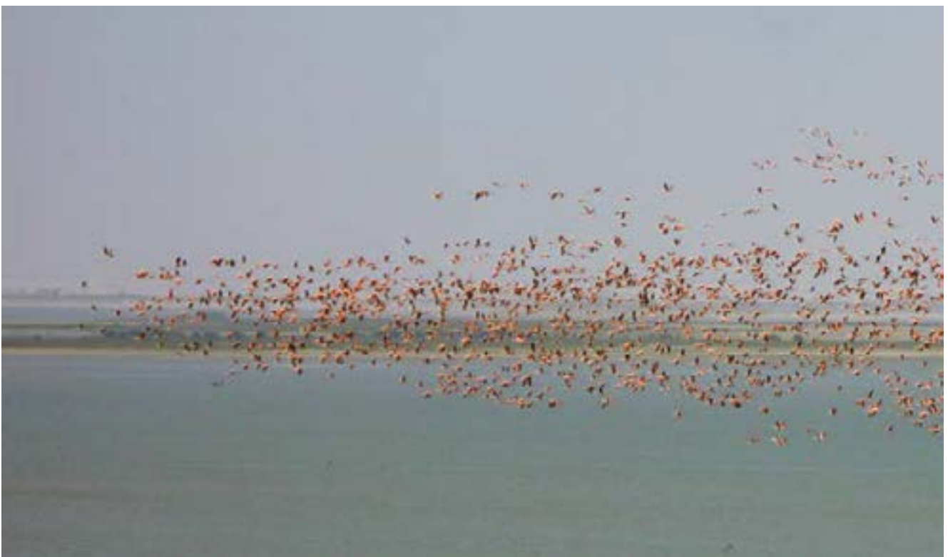
Fotografía 4. Bandada de flamencos. Laguna de los Flamencos, sector Médano Grande. 18 de octubre de 2009. 11.00 a. m.