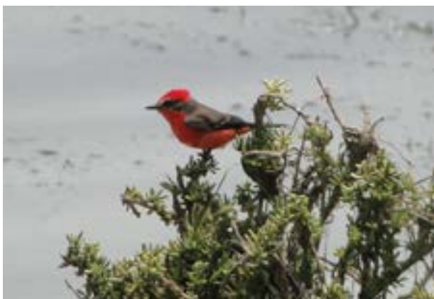
Fotografía 21. Putilla ( Pyrocephalus rubinus )