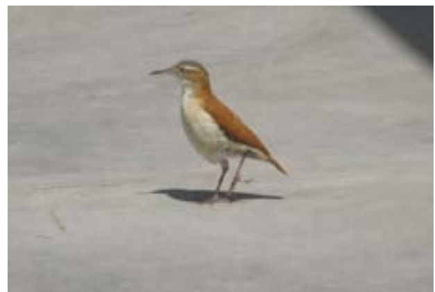
Fotografía 22. Chilalo ( Furnarius leucopus )