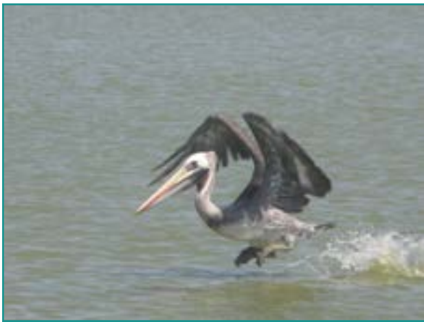
Fotografía 19. Pelicano peruano ( Pelecanus thagus )