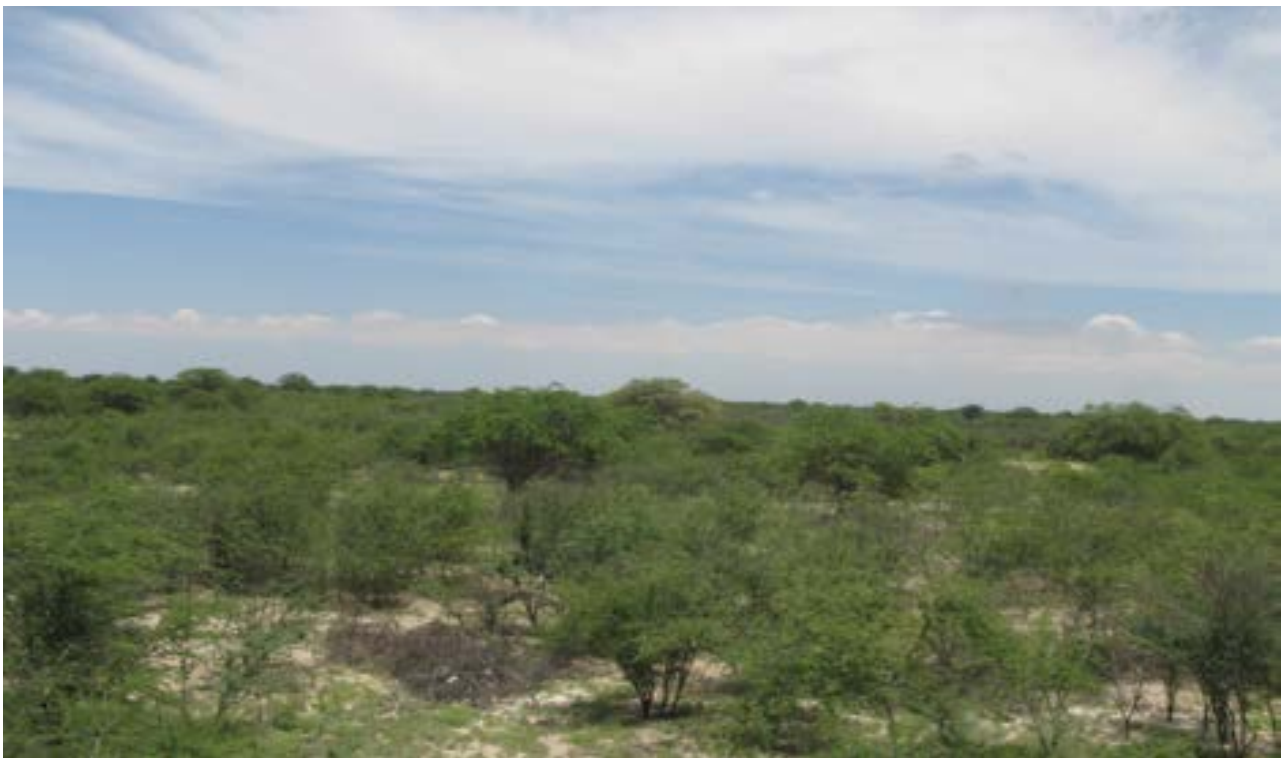
Fotografía 2. Pampa de San Antonio, 2010