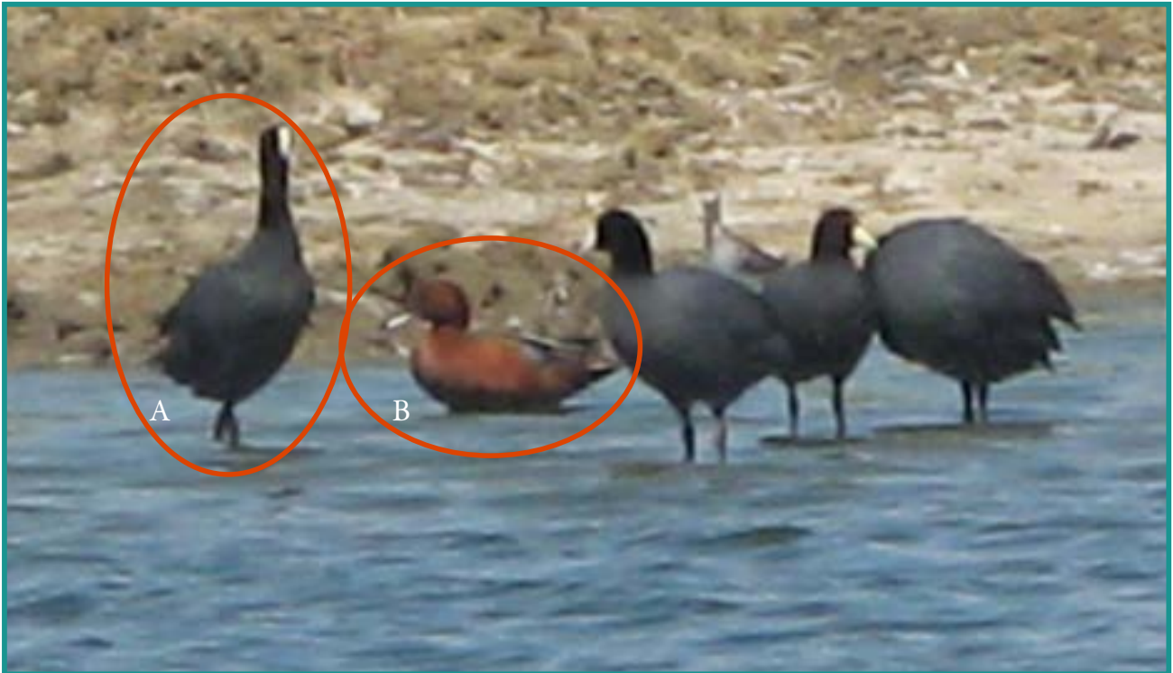
Fotografía 16. A) Gallareta andina ( Fulica ardesiaca ), B) Pato colorado ( Anas cyanoptera )