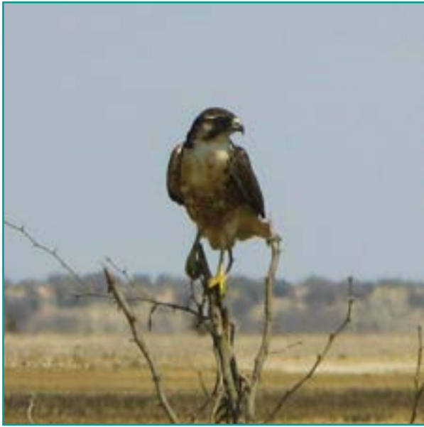
Fotografía 23. Gavilán ( Accipiter nisus )