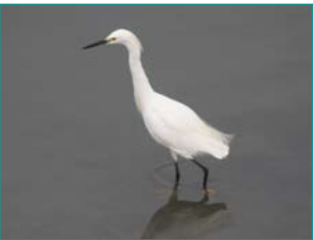
Fotografía 14. Garza blanca ( Egretta thula )