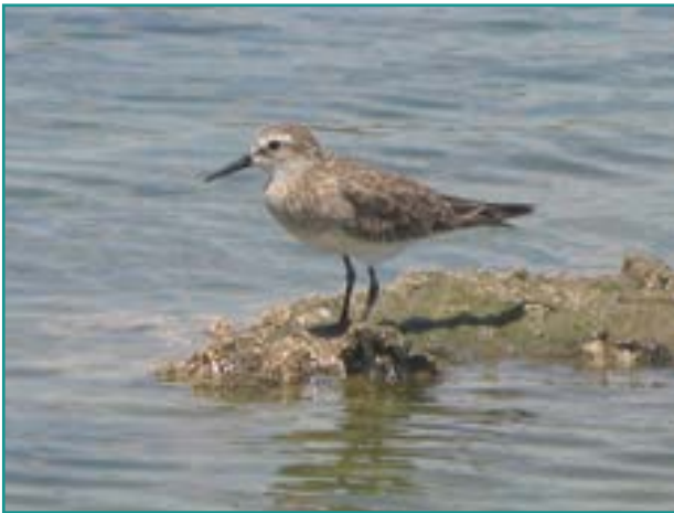
Fotografía 12. Playerito ( Calidris mauri )