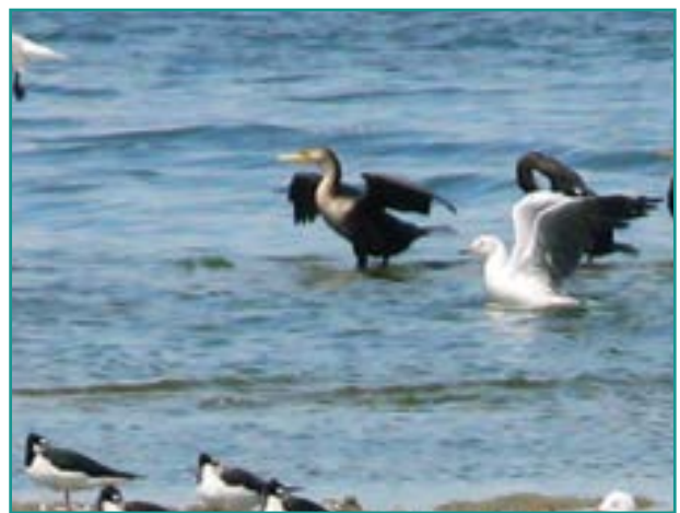
Fotografía 15. Cormorán ( Phalacrocorax brasilianus )