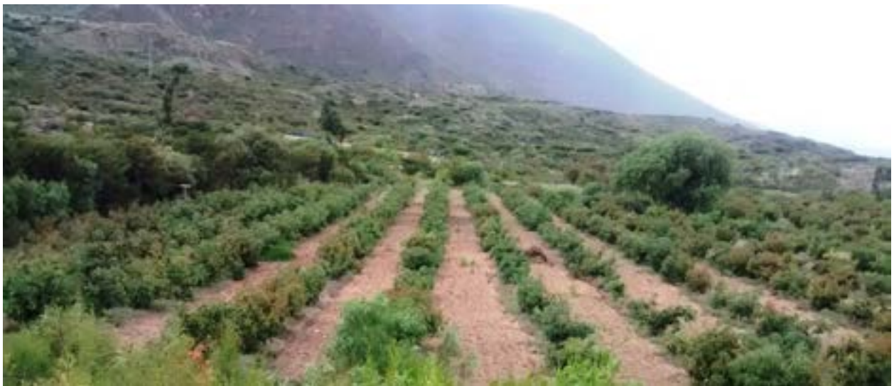
Figura 1: Centro Pirwacocha

Esta experiencia es transmitida a las comunidades vecinas para la promoción y desarrollo de esta economía frutícola, como alternativa para el mejoramiento de la calidad de vida de los pobladores.